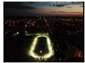
Áreas Deportivas & Recreativas