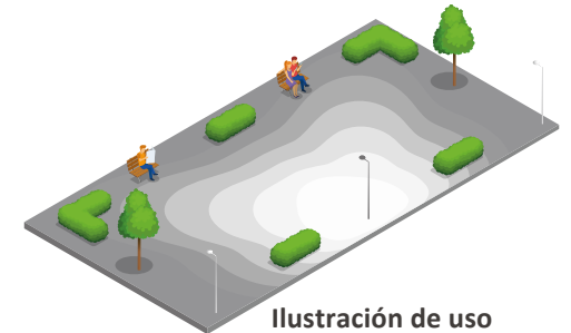
Ilustración de uso