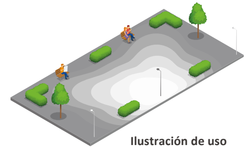
Ilustración de uso